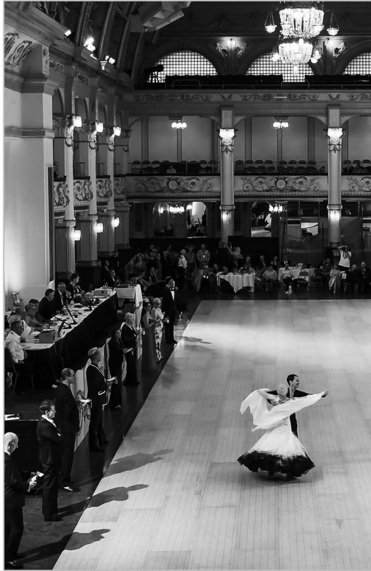
Dante - Blackpool 2014